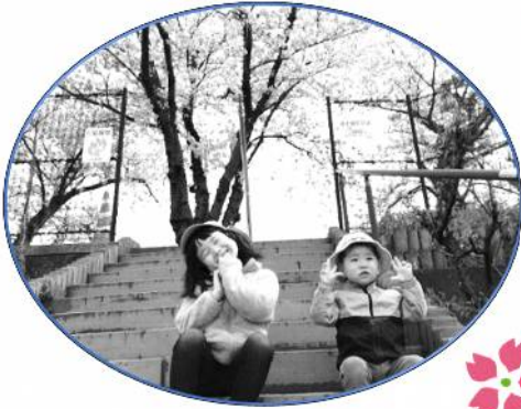
さくら き した 桜の木の下で ハイチーズ☆