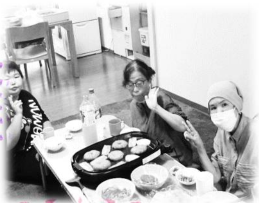
なつ おおそうじ あと 夏の大掃除の後に ハンバーガーを作ったよ