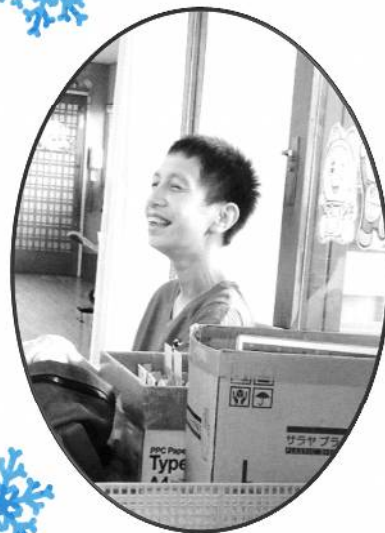
ことし すてき おん 今年も素敵な1年に なりますように🐰