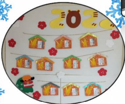
いろいろ おが 色々なことをお願いしました🐯