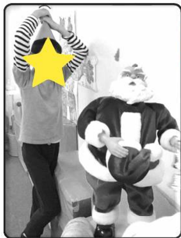
あそ サンタのおもちやで遊んだよ