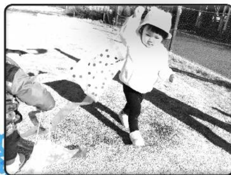
たこ 凧あげをしたよ😊