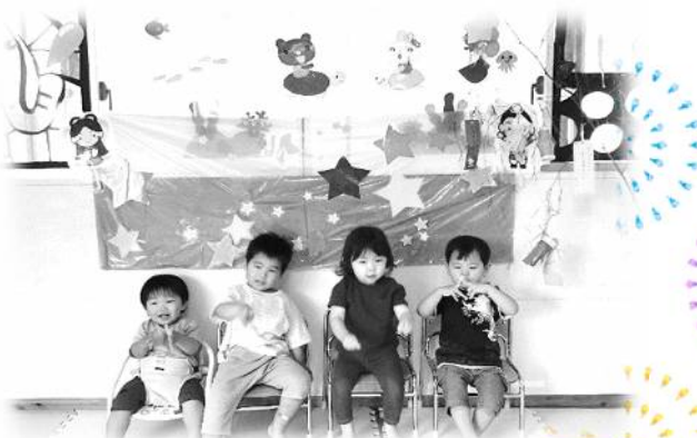
ざさ たんざく 笹に短冊をつけたよ☆