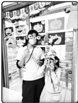
ハッピーハロウィン🎃!!!