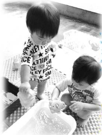
みずあそび 水遊び🌟