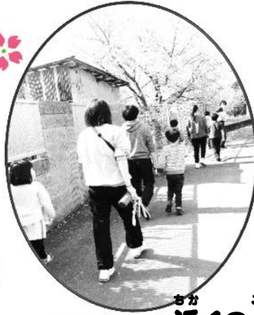
まが こうえん さん ぼ い 近くの公園にお散歩に行ったよ🌸