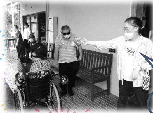
あつ なつ けきは 暑い夏を撃破!!!