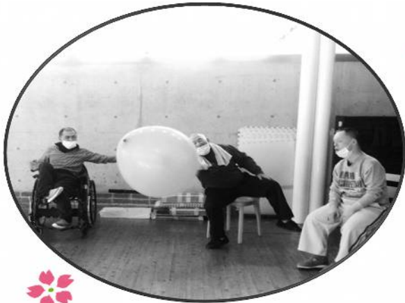
みんな で つなげ ♪ ふうせん 風船バレー★